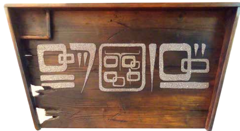
P. Rossi Lavatoio