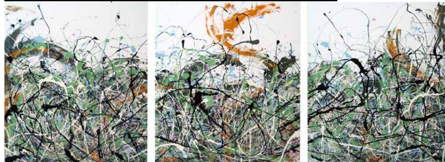
S. Gravina Trittico