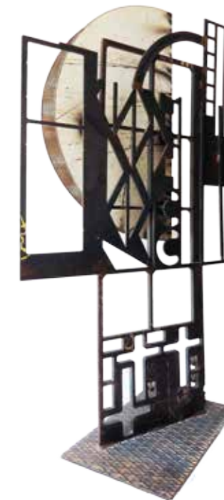
C. Bellomonte Résumé Ca 11