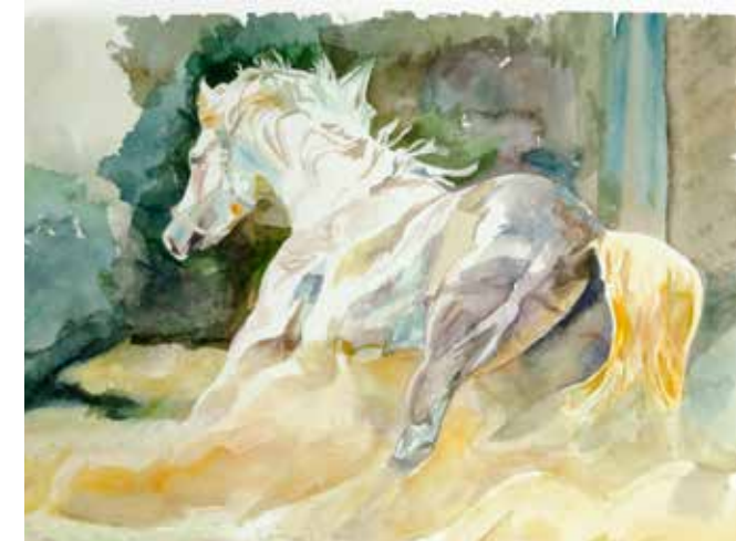
P. Maccacaro Oltre la foresta