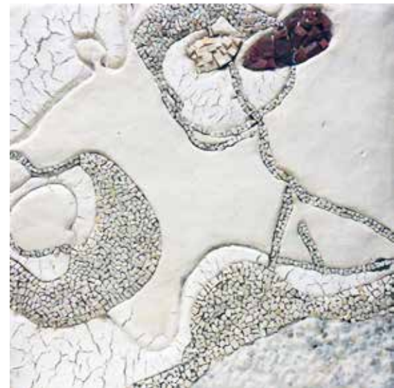
M. Maccacaro Paesaggio