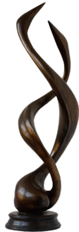
E. Tramontano Nike senza fine

TENUTE UGOLINI STRADA DI BONAMICO 11 - 37029 S. PIETRO IN CARIANO - (VR) ITALIA